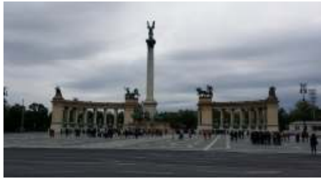
“La Piazza degli Eroi”

Dietro la piazza troviamo lo “Stabilimento termale con la piscina Széchenyi” , qui inizia il parco civico della città, dove al centro si erge il “Castello Vajdahunyad” in stile composito, infatti lo stesso è stato costruito con vari stili (romanico, gotico, rinascimentale e barocco). Abbiamo però poco tempo e non entriamo al suo interno, che ospita il “Mezogazdasági Muzeum” , visitiamo quindi solo l'esterno ed una parte del parco. Riprendiamo quindi la metropolitana e troniamo in centro per un po' di shopping.