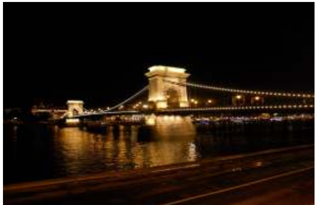
“Il Parlamento dal battello e il Ponte delle Catene di notte”