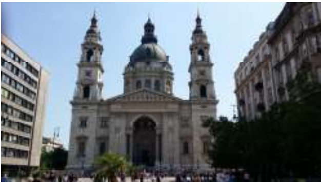
“La Basilica di Santo Stefano”

www.hoponhopoff.hu ed iniziamo il giro panoramico della città con la linea rossa, ma scendiamo alla prima fermata in cima alla “Collina della Fortezza” .