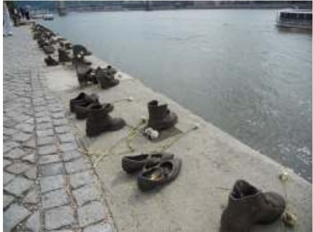
“Scarpe sul Danubio”

La discesa la effettuiamo a piedi scendendo lungo le scalinate, passando per la “Cappella nella Rocca” , ricavata all’interno di una grotta naturale, dove sulla terrazza antistante la Cappella stessa sorge la “Statua di Santo Stefano con il suo cavallo” . Arriviamo quindi al “Ponte della Libertà” che attraversiamo e raggiungiamo così la fermata della metropolitana Calvin ter (linea blu) e proseguiamo fino al campeggio dove arriviamo ancora una volta stanchi ma appagati.