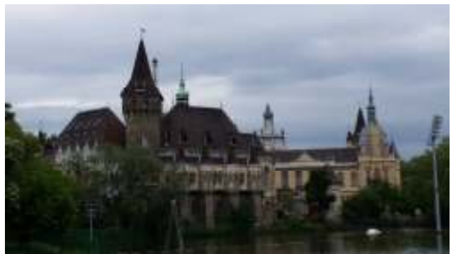
“Il Castello Vajdahunyad”

Rientriamo in campeggio per l'ora di pranzo, mangiamo, scarichiamo e carichiamo le acque e partiamo alla volta dell'Italia. Usciamo dalla città e imbocchiamo subito l'autostrada. Il percorso si snoda lungo l'itinerario dell'andata. Ci fermiamo per la cena appena passato il confine italiano e dopo cena proseguiamo fino nei pressi di Verona, dove ci fermiamo in un'area di sosta autostradale per la notte.