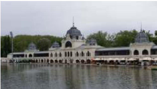
“Lo stabilimento termale”

Dietro la piazza troviamo lo “Stabilimento termale con la piscina Széchenyi” , qui inizia il parco civico della città, dove al centro si erge il “Castello Vajdahunyad” in stile composito, infatti lo stesso è stato costruito con vari stili (romanico, gotico, rinascimentale e barocco). Abbiamo però poco tempo e non entriamo al suo interno, che ospita il “Mezogazdasági Muzeum” , visitiamo quindi solo l'esterno ed una parte del parco. Riprendiamo quindi la metropolitana e troniamo in centro per un po' di shopping.