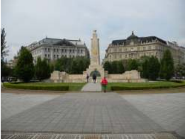
“Piazza della Libertà”

quindi di proseguiamo lungo il “Danubio” , dove incontriamo uno dei monumenti più originali della città: “Scarpe sul Danubio” di Gyula Pauer. Il monumento commemora gli ebrei fucilati e gettati nel “Danubio” dai nazisti. Raggiungiamo quindi l’ormai noto “Ponte delle Catene” , che attraversiamo fino alla partenza della funicolare per la “Collina della Fortezza” dove prendiamo nuovamente il bus scoperto “hop on hop off” , ma la linea gialla, per visitare, seguendo questo nuovo percorso, i rimanenti luoghi della città. Terminiamo il giro ancora alla partenza della funicolare e saliamo sulla linea rossa che ci porta in cima alla “Cittadella” , scendiamo e visitiamo questa città fortificata eretta dagli austriaci nel 1851 con annesso un museo delle cere, situato nel vecchio bunker tedesco con rievocazioni dell’occupazione nazista. In cima si innalza la “Statua della Libertà” .