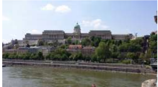
“La collina della Fortezza”