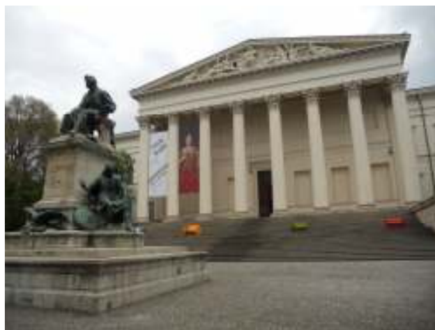
“Magyar Nemzeti Mùzeum”