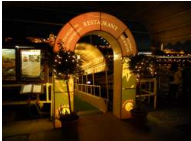
“L’ingresso al battello”

Una hostess ci accompagna al punto di imbarco e inizia questa mini crociera allietati da una piccola orchestra “Ròbert Bàder and his Gipsy Band”. La città piano piano si illumina e la vediamo nel suo splendore. Terminata la cena passeggiamo sul lungo “Danubio”. La città ha un grande fascino con le luci gialle dei lampioni. Sono ormai le 22,00 e siamo un po’ stanchi e quindi prendiamo la metropolitana e rientriamo in campeggio, domani ci aspetta un’altra giornata di visita. Giornata stupenda: sole e caldo!