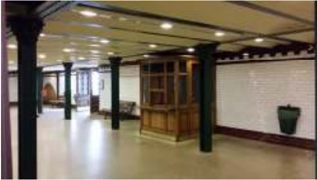
“Una stazione della metropolitana linea 1”