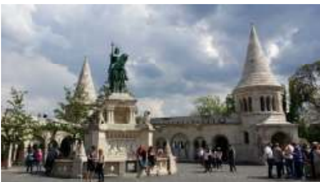
“Il Bastione dei Pescatori”