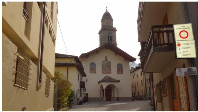
“Cogne: la parrocchiale”

Il mattino seguente, sabato, girovaghiamo per il paese. Il tempo è bellissimo, splende un magnifico sole e non fa neppure freddo e al pomeriggio decidiamo di percorrere il sentiero fino alle “ Cascate di Lillaz ”. Il sentiero è il numero 23 che parte dal paese troviamo le frecce indicatrici del “ Parco Nazionale del Gran Paradiso ”. Il dislivello totale è di solo 350 metri e il sentiero non è altro che una strada sterrata immersa nei boschi fino alla frazione di “ Lillaz ”, qui si attraversa in mezzo alle case fino all'imbocco del sentiero in leggera salita fino al punto panoramico sotto la cascata (GPS N=45°35'38,30” E=07°23'49,10” m 1.640 s.l.m.). Abbiamo camminato circa un'ora e mezza, comprese le soste per qualche foto. Il ritorno avviene sullo stesso percorso dell'andata.