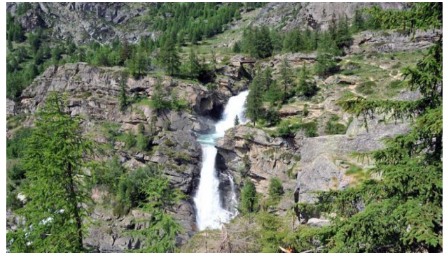
“Le cascate a Lillaz”