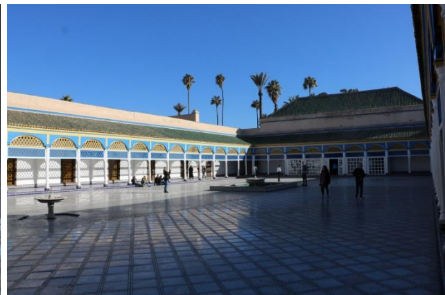
“Marrakech: incantatori di serpenti & Palais Bahia”