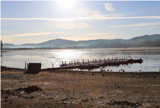
“Il Lago Dayet Aoua”