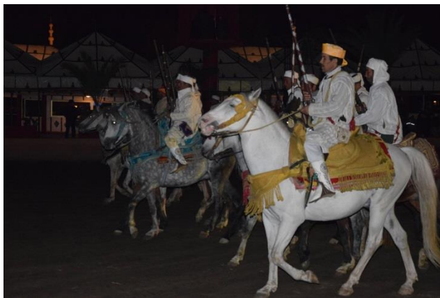
“Marrakech: spettacolo berbero”

Arriviamo a “Marrakech” alle 17,40 e ci rechiamo per la visita alla “Menara” (park di fronte: (GPS= N=31°36'42,20" O=08°00'53,90" m 475 s.l.m.): un grande bacino d'acqua nel quale si specchiano le vette dell' “Atlante” ). Il tutto immerso in un grande giardino recintato da un muro di terra lungo 1,2 chilometri e largo 800 metri, con ulivi e palme, utilizzato come luogo e di svago dai sultani. Terminata la visita riprendiamo il nostro cammino fino al campeggio in città: Camping Ourika Camp (GPS= N=31°31'37,40" O=07°57'34,20" m 575 s.l.m.). Il campeggio è un vero e proprio campeggio, in stile occidentale, con tutti i servizi e piazzole veramente grandi, con camere d'albergo. Parcheggiati i mezzi ci prepariamo per la serata marocchina. Alle 20,30 ci aspetta il bus che ci porterà al “Chez Ali” www.restaurant-chez-ali.com una grande struttura (molto turistica) dove ceniamo a base di specialità marocchine (GPS= N=31°42'08,50" O=08°01'15,00" m 400 s.l.m.): cous – cous e agnello alla brace. Al termine della cena, nel grande campo centrale alla struttura, assistiamo allo spettacolo berbero con bellissimi cavalli (costo € 50,00: un po' caro!). rientriamo al campeggio a mezzanotte.