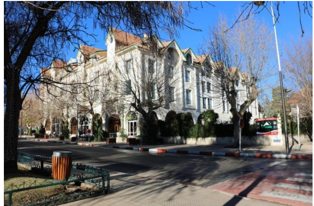
“Ifrane: la Svizzera marocchina”

La cittadina, all'interno dell' “Ifrane National Park” è considerata la “Piccola Svizzera” (Svizzera marocchina) ed è inoltre considerata la città più pulita al mondo secondo la NBC News ed è inoltre sede, dal 1995, della “Al Akhawayn University” . La ha un aspetto quasi alpino, immersa in boschi di cedri e pini, con villette, chalet, alberghi e complessi residenziali. Abbiamo trovato anche la neve! Ripercorriamo la strada fatta all'andata fino ad imboccare l'autostrada A-2 in direzione “Rabat” . Ci fermiamo in autostrada per il pranzo e per il rifornimento e alle 15,00 circa siamo a “Rabat” , dove parcheggiamo proprio di fronte all'ingresso del “Mausoleo di Mohammed V” ( GPS=N=34°01'20,40" O=06°49'23,60" m 40 s.l.m. ). Saliamo sul ripiano che ospita “Torre di Hassan” con i resti della “Moschea” che è stata iniziata nel 1195 da Yacoub el-Mansour con l'intento di farne il più importante santuario del mondo islamico, ma abbandonata alla sua morte, della quale restano solo le colonne.