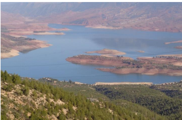
“Lago Bin el Ouidane”