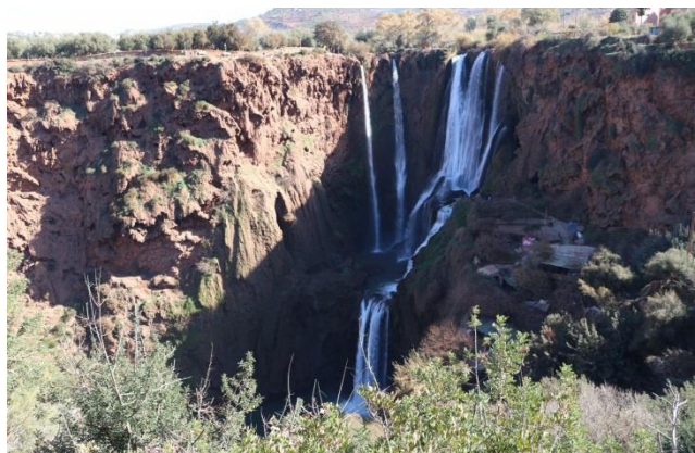
“Le cascate di Ouzud”