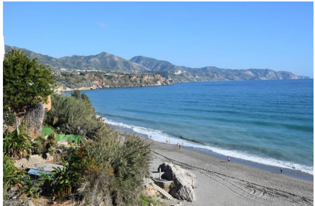
“ Nerja ”: il “ Balcone d’ “Europa ”