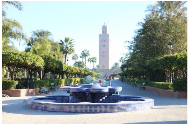
“Marrakech: Place Jemaa el-Fna e la Moschea della Koutoubia”