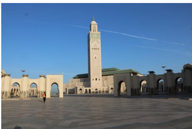
“Casablanca: Moschea Hassan II”

Tempo bello anche oggi e anche oggi si parte che non è ancora chiaro: sono le 7,00. Pochi chilometri ci dividono da “Casablanca” dove arriviamo alle 8,30 e, proprio di fronte alla “Moschea di Hassan II” , www.mosqueehassan2.com parcheggiamo i camper (GPS= N=33°36'13,70" O=07°37'54,90" m. 10 s.l.m.). Ci avviciniamo all'ingresso della moschea dove ci aspetta la guida locale per la visita che inizierà alle 9,00. Entriamo in questa grande moschea inaugurata nel 1993 su progetto dell' architetto francese Michel Pinseau e rimaniamo affascinati dalla bellezza dei suoi interni. Il complesso è stato costruito in riva all' “Atlantico” (in parte su terreno strappato all'oceano), su una superficie di 90.000 mq! La visita dura circa un'ora e all'uscita abbiamo tempo per le foto. Ripartiamo alle 10,30, alla volta di “Marrakech” , dove arriviamo alle 18,30 dopo aver percorso circa 250 chilometri.