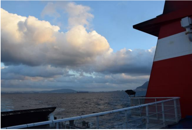
“In navigazione verso il Marocco”