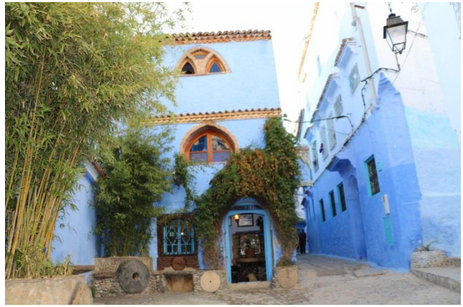
“Chefchaouen: la città blu”

al parcheggio (GPS= N=35°09'57,90" O=05°15'42,60" m. 550 s.l.m.) alle 16,00. Inizia così la prima visita in terra marocchina. Percorriamo su e giù la “ medina ” di questa simpatica cittadina tutta colorata di blu e scattiamo molte foto. La città fu fondata nel 1471 da Moulay Ali ben Rachid, vietata agli occidentali fino al 1920, si trova nel cuore della “ catena montuosa del Rif ”. Ha una medina piccola e tranquilla formata da case imbiancate a calce con la base di azzurro elettrico che la rendono affascinante. Terminata la visita, alle 17,30 circa, riprendiamo i nostri mezzi e ci dirigiamo nuovamente verso sud sulla N-13 in direzione “ Moulay Idriss ”. Dobbiamo percorrere ancora quasi 200 chilometri circa di strada! Arriviamo al campeggio alle 21,30: Camping Zerhoun Belle Vue (GPS= N=34°00'51,50" O=05°33'42,80" m. 460 s.l.m.). Il campeggio è di discreto livello con piscina e una vista stupenda sul paesaggio circostante.